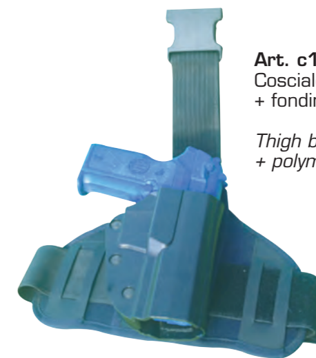
Art. c1f Cosciale moncinghia + fondina in polimero e pelle

Thigh belt strap + polymer and leather holster