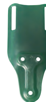
Art. pb2 Supporto per fondina basso

Thigh belt strap + polymer and leather holster