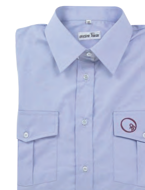
Art. cmpl Camicia 100% cotone tessuto Oxford

Barrel holder pouch in multicam syst. M.o.l.l.e