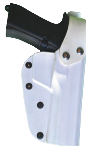
Art. de88 Fondina in pelle e poli- mero + estrazione rapida

Feed Through that allows a 360°rotation of our holsters Arc of security level 1 for quick release Leather and polymer injected holster