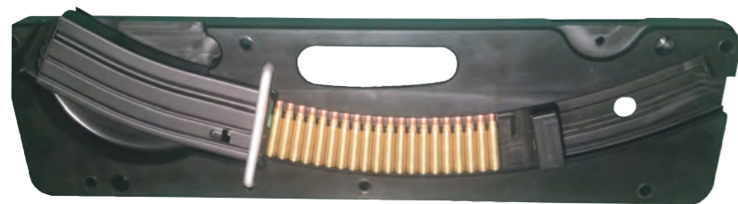
Art. ccb01 Carica caricatore da banco x 2.23 - 5,56 - 300 aac munizioni lunghezza standard Nato 57 mm

Refill Charter x 2.23-5.56-300 aac ammunition made 57 mm Standard length)