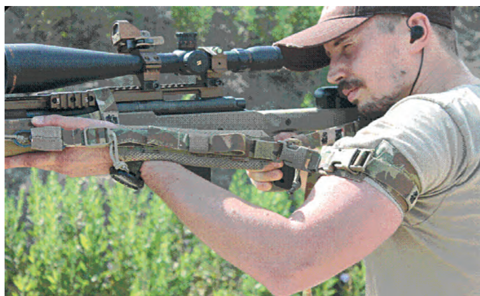
Art. clf Fascia da braccio - regolabile - removibile

Refill Single Charter 2.23-5.56-300 aac ammuni- tion made 57 mm standard lenght.