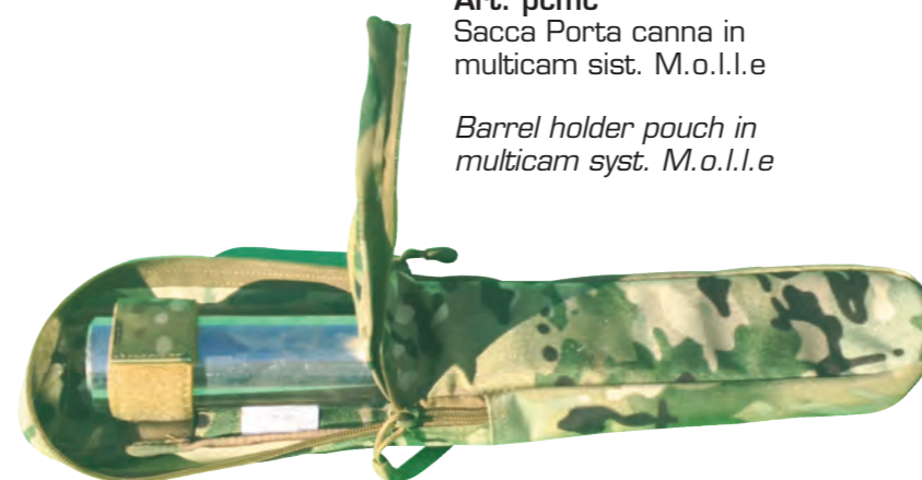
Art. pcmc Sacca Porta canna in multicam sist. M.o.l.l.e

Barrel holder pouch in multicam syst. M.o.l.l.e